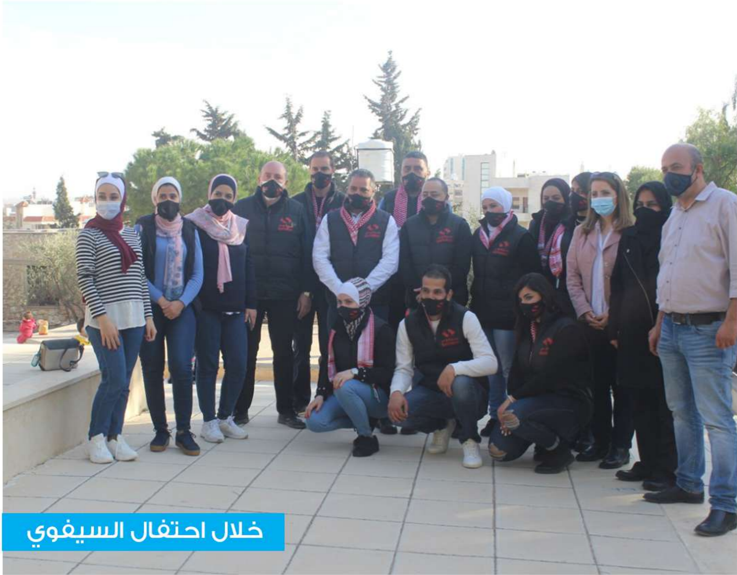
خلال احتفال السيفوي

• جددت الجمعية شراكتها مع أمديست الأردن والتي يتم من خلالها إتاحة الفرصة للأطفال والشباب في قرى الأطفال للمشاركة في دورات اللغة الإنجليزية التي تعقدتها أمديست والتي تدعم تعليمهم وتزودهم بالمهارات الضرورية لبناء مستقبلهم بنجاح وليكونوا أعضاء فاعلين في مجتمعهم.